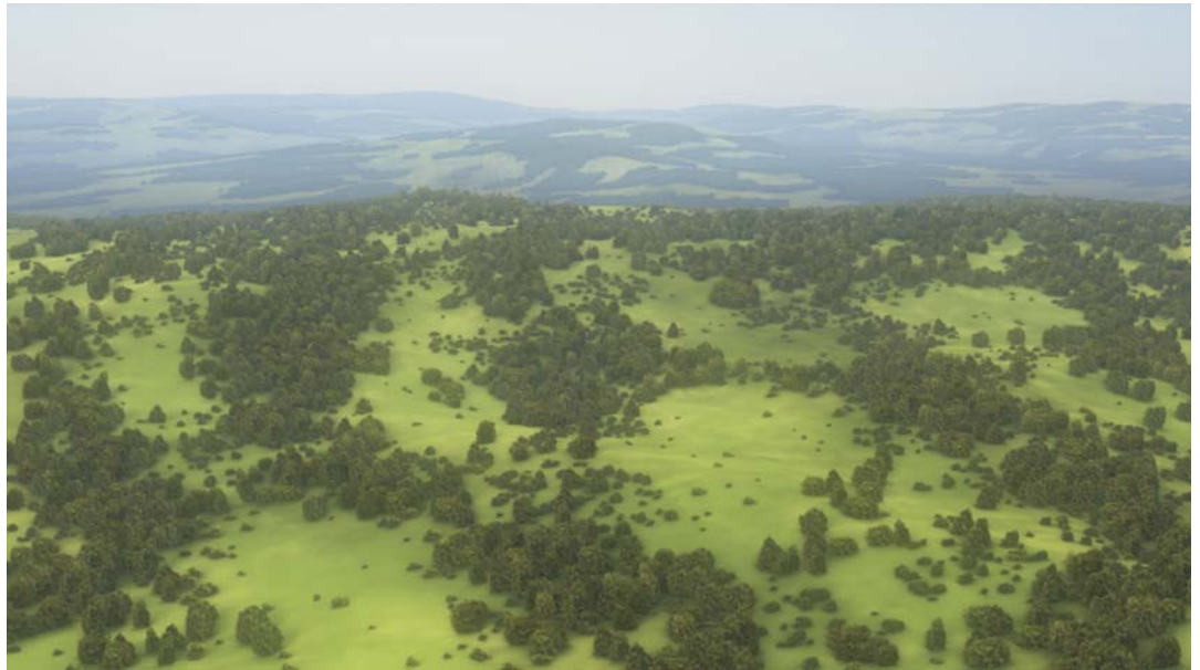
Still dal video N.movi - 2011

Inaugurazione Sabato 12 Maggio ore 11.30