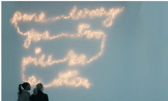
SHILPA GUPTA - Don't worry you too will be a star - 2007 - metallo verniciato e filo di luci - dimensioni variabili

Con quale atteggiamento ci si pone di fronte a una cultura artistica praticamente sconosciuta sino a pochi anni fa? La passione per l'India come del resto quella per la Cina deriva dal senso di novità che promana da questi Paesi, dai loro artisti e dalla loro arte. Ci si trova ad essere quasi degli esploratori, dei pionieri, e in questo modo si