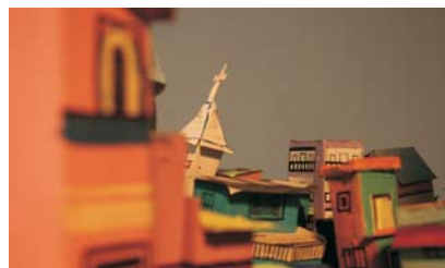
HEMA UPADHYAY Senza titolo (dettaglio) - 2008 183 x 244 x 122 cm.

il peso della tradizione, le contraddizioni sociali, la spinta verso il futuro, sembrano mescolarsi in maniera caotica e difficilmente comprensibile ad un occhio "occidentale".