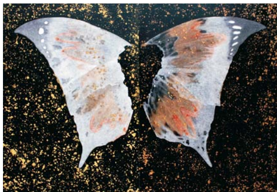
ASHIM PURKAYASTHA - Wings with black watermarks - 2007 acrilico su tela - 228.6 x 317.5 cm.

il peso della tradizione, le contraddizioni sociali, la spinta verso il futuro, sembrano mescolarsi in maniera caotica e difficilmente comprensibile ad un occhio "occidentale".