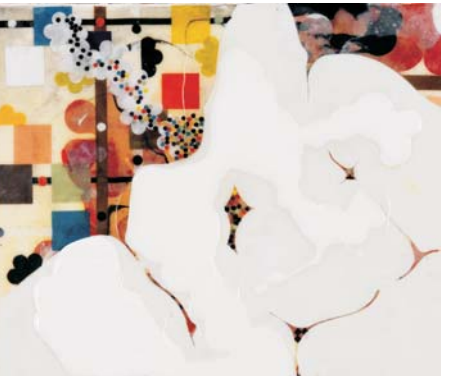
In alto a destra: JACOB HASHIMOTO Cyclon and the wonder wheel - 2008 (dettaglio)