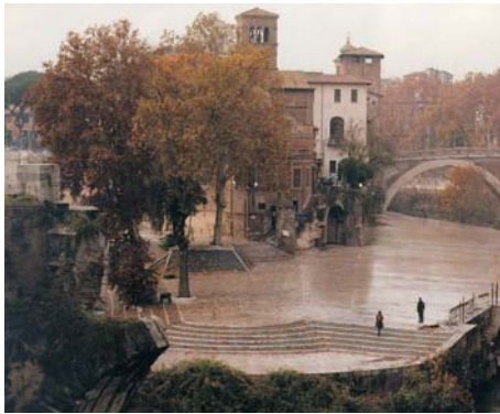
In alto da sinistra: GABRIELE BASILICO - Roma - 2008 (dettaglio) DAVID LINDBERG - 350.000 B.C - 2009 (dettaglio)