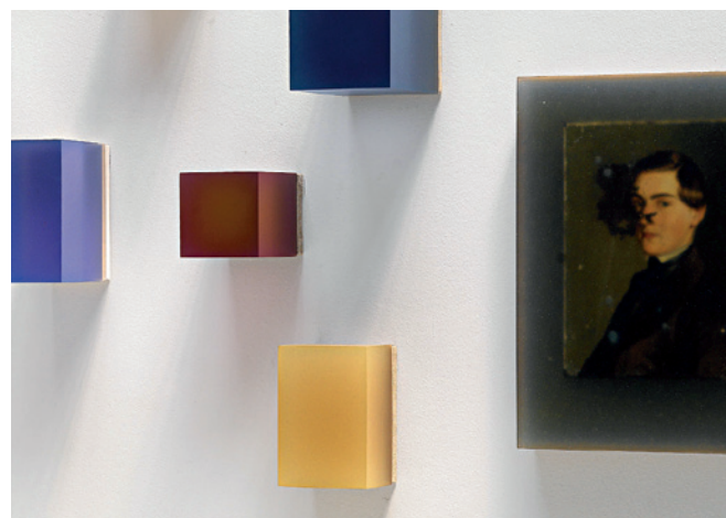
Herbert Hamak Antipodi installation view, Studio la Città - 2010