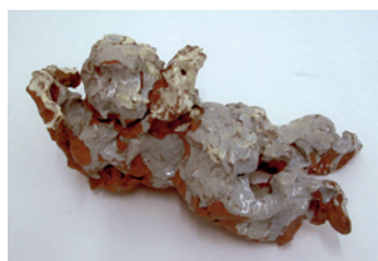
Lucio Fontana Cupido - 1947 Terracotta smaltata / Glazed terracotta 27 x 17 x 12 cm Arch. Fontana 1966/16