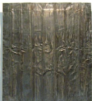
Pier Paolo Calzolari Senza Titolo - 1979 Sale, piombo, piastra in ferro, lumino ad olio Salt, lead, iron plate, oil light 208 x 87 x 7,5 cm