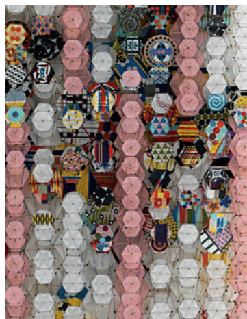
Jacob Hashimoto Mythologies and love - 2010 Carta, dacron, bambù, filo di nylon, acrilico Paper, dacron, bamboo, nylon, acrylic 152 x 122 x 20 cm