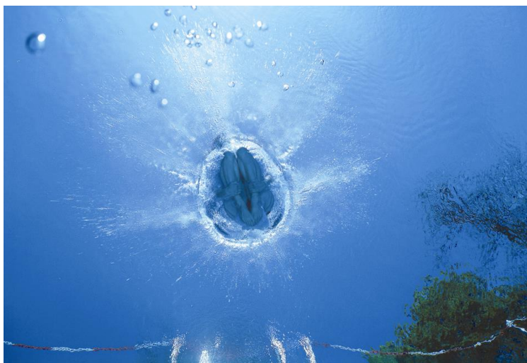
Diver, 2003, lightbox, 80 x 125 cm.

Inaugurazione Sabato 10 Luglio 2004 Ore 11,30