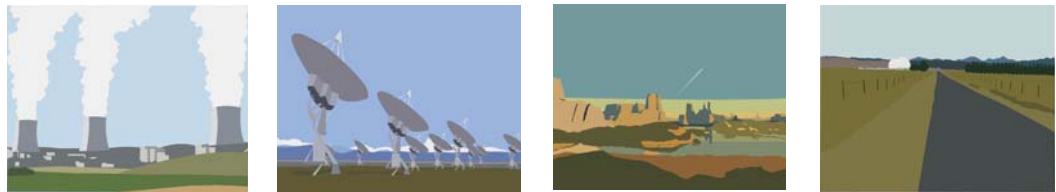
Brian Alfred - Majic Window , 2009 - video animazione digitale su DVD

Studio la Città sarà inoltre presente all'interno della rassegna "Visione Video", a cura di Maria Rosa Sossai, con l'opera Majic Window dell'artista americano Brian Alfred .