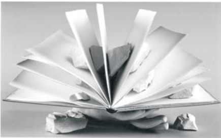
Giulio Paolini - L'Arte e lo Spazio , 1983 31 x 25,5 x 36 cm