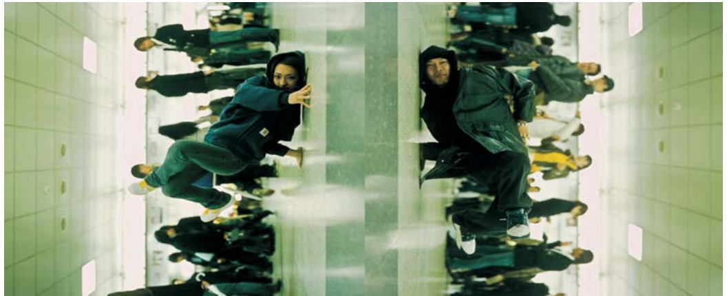
Shaun Gladwell - In a Station of the Metro , 2006 - DVD - Ed. 3/3

Tra le altre, saranno presentate nel nostro stand le opere di: