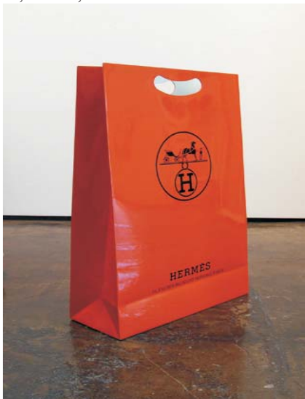
Jonathan Seliger - Hansom , 2008 - Bronzo, 91,5x61x22,9 cm

Durante tutta la manifestazione si susseguiranno all'interno di "Videoràma", uno stand creato ad hoc per l'occasione, lavori selezionati tra il repertorio di opere video delle due gallerie.