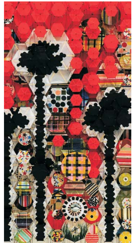
Jacob Hashimoto - 2008 Untitled (dettaglio) , bambù, carta, dacron, acrilico 148 x 117 x 20 cm

CI POTRETE TROVARE IN FIERA AL PADIGLIONE 10 STAND A3-B2 DAL 17 AL 21 SETTEMBRE 2009. PER ULTERIORI INFORMAZIONI POTRETE CONTATTARCI AL NUMERO TELEFONICO +39.349.3677.002 OPPURE AL +39.335.212.356