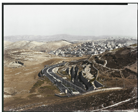
V. Castella, Mal'eadumin, 2007