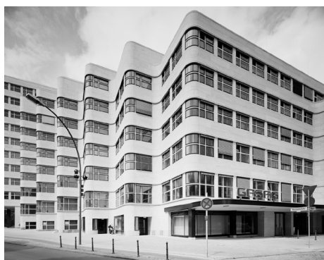
G. Basilico, Berlino 2000A3-129, 2000