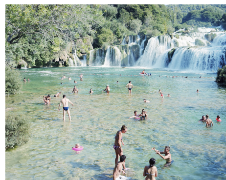
M. Vitali, # 3946 - Krka Waterfall Pink, 2009

Una mostra, curata da Angela Madesani, che ospita le opere di tre protagonisti del panorama italiano della fotografia: Gabriele Basilico, Vincenzo Castella, Massimo Vitali. Una riflessione su un' importante stagione della fotografia e della teoria ad essa correlata nel nostro paese, che si propone di aprire il dibattito verso nuove letture e più ampie prospettive. Una riflessione su una possibile scuola italiana di fotografia, attraverso la ricerca dei tre artisti.