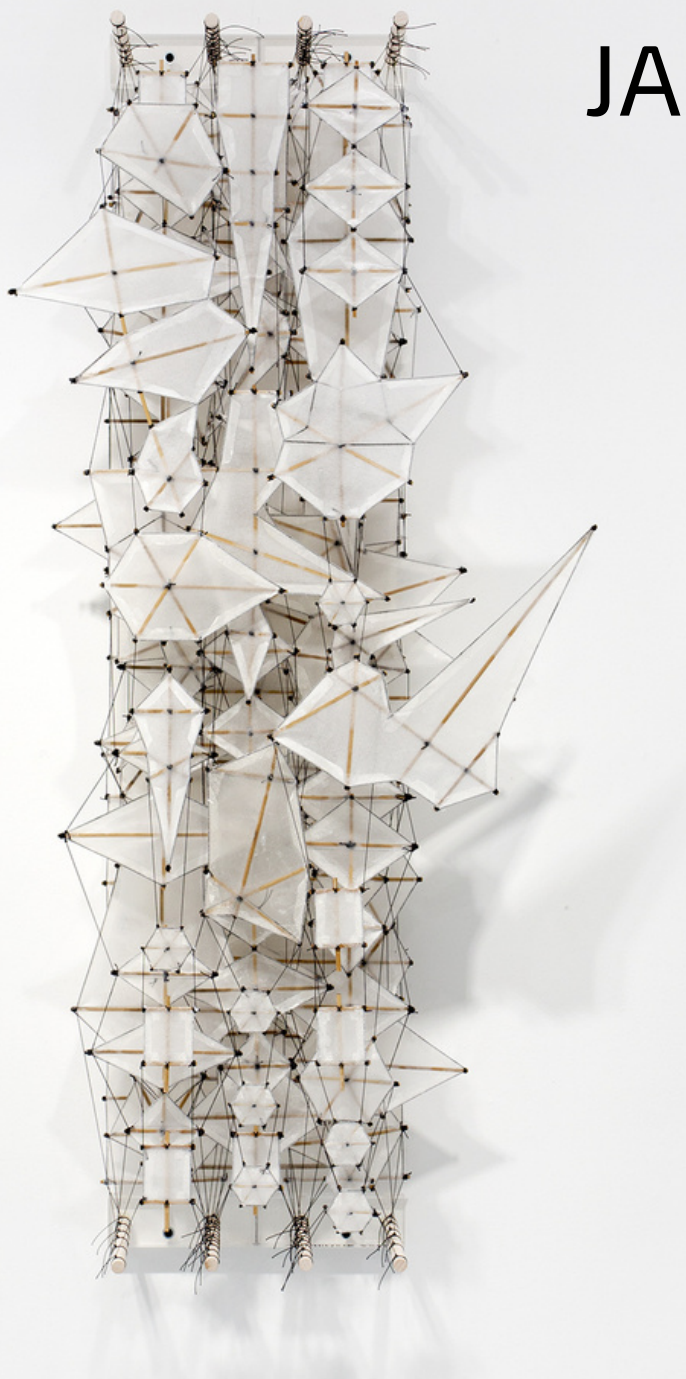
Untitled, 2022, carta, bambù, acrilico, dacron, 122 x 48 x 21 cm